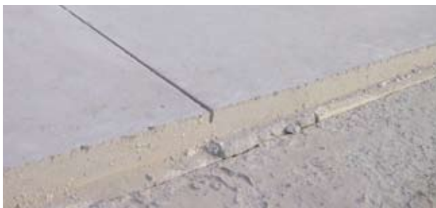
Figur 2. SCC gulv med perfekte kanter og skårne fuger.

Der er heller ingen risiko for, at kanter på tilstødende beton knuses af bjælkevibratoren, når ny beton udstøbes.