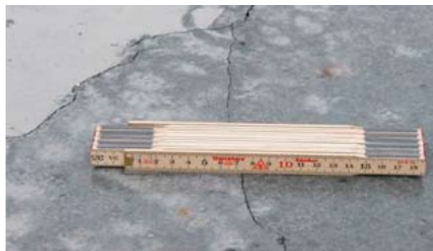
Figur 9. Revner pga. manglende udtørningsbeskyttelse.

Hvis overfladen er færdiggjort som juttet overflade, vil der gå nogen tid (3 - 4 timer), inden den kan tildækkes med en plastfolie, da det ellers vil medføre mærker fra folien.