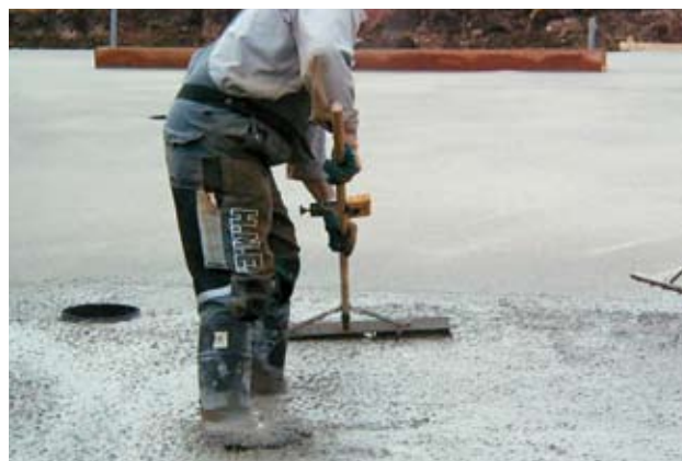
Figur 5. Grovfretning, asfaltskraber med lasercensor.

SCC er ikke selvnivellerende, og for at opnå den fulde arbejdsbesparende fordel ved SCC, er det vigtigt at udlægningsen sker med en så ensartet tykkelse som muligt, f.eks. kontrolleret med laser og "grovfrettet" med en asfaltskraber.