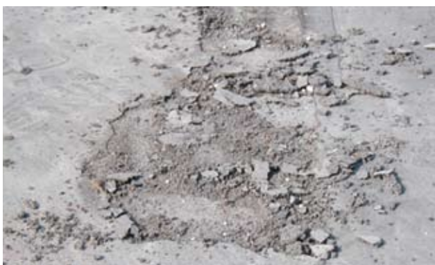
Figur 8. Afskalning efter glitning af gulv.

Maskinglitning med vingeglitte medfører en kraftig påvirkning af betonen i stor dybde, og der er en del eksempler på, at man får "overglittet" betonen, og derfor får problemer med "vabler" eller afskalning af større områder.