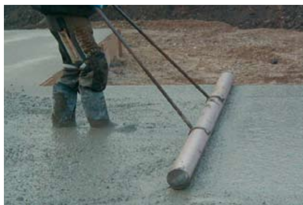
Figur 6. Jutning af overflade.

Den afsluttende afretning sker med en såkaldt "jutter", et let rør af plast eller aluminium, som påføres lette pulserende bevægelser, som komprimerer og udglatter de øverste 2 - 3 cm af betonlaget.