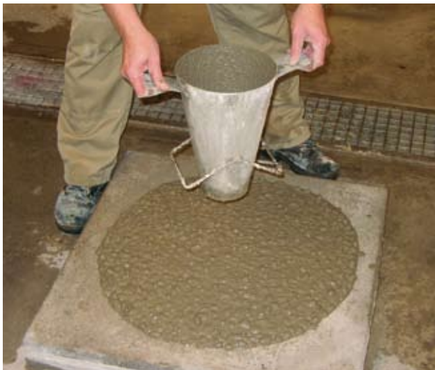
Figur 1. Selvkomprimerende beton, SCC.

SCC er den officielle betegnelse for beton, som i forhold til traditionel plastisk beton (sætmålsbeton) kræver meget lidt bearbejdning i forbindelse med udstøbning, i visse sammenhænge slet ingen. Ofte omtales SCC også som flydebeton, vibreringsfri beton, eller vibreringslet beton, som måske mere end andre navne er dækkende for betonens bearbejdningmæssige egenskaber.