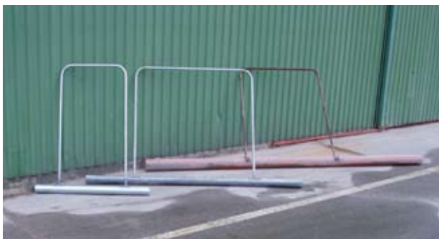
Figur 7. Udvalg af juttere.