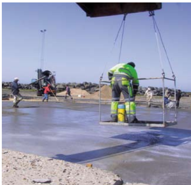
Figur 10. Påføring af forseglingsmiddel på store felter.

En foreløbig beskyttelse med et forseglingsmiddel efterfulgt af afdækning med plastfolie kan være en ekstra sikring mod plastiske svindrevner og mangelfuld hærdning.