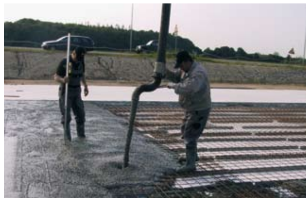
Figur 4. Støbefront ved udstøbning med pumpe.

Ved udstøbning af gulve bør SCC udlægges på traditionel vis med opbygning af en støbefront, således at risikoen for støbeskel minimeres. Støbefronten vil dog typisk være bredere end ved støbning med traditionel beton.